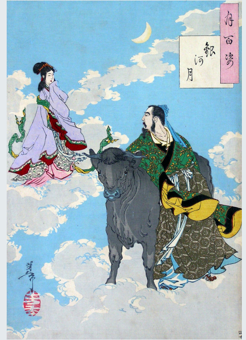
Tsukioka Yoshitoshi dans Cent aspects de la lune

Plonge toi dans l'histoire des amants célestes, Véga et Altaïr ; et retrouves-y les inspirations de Camille Pépin pour les "Eaux célestes".