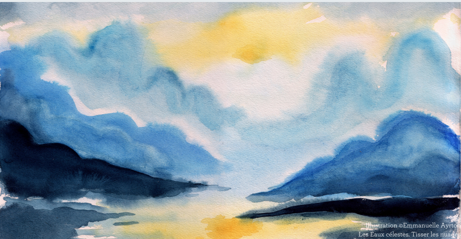
Illustration ©Emmanuelle Ayrton Les Eaux célestes. Tisser les nuages