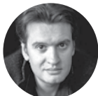
MATTHIEU HERZOG Humanismes d'Orient et d'Occident © Rémi Rieire