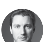
JULIEN LEROY L'Épopée de Gilgamesh