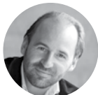
PIERRE BLEUSE Concert du Nouvel An