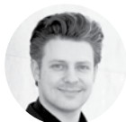
JOSEPH BASTIAN Instantanés d'Amérique