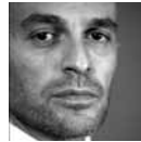
Roberto Rizzi Brignoli La Traviata