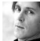
Paul Meyer Haydn, Mozart, Schubert