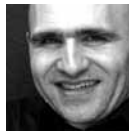
Jacques Saint-Yves Jeunes compositeurs