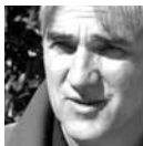
Daniel Kawka Le Festin de l'araignée Roussel, Berlioz, Pauset