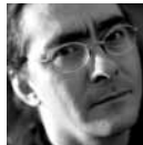
Brice Pauset La Théorie des Larmes L'Opéra de la Lune