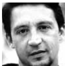
Dominique Dournaud Compositeurs exilés